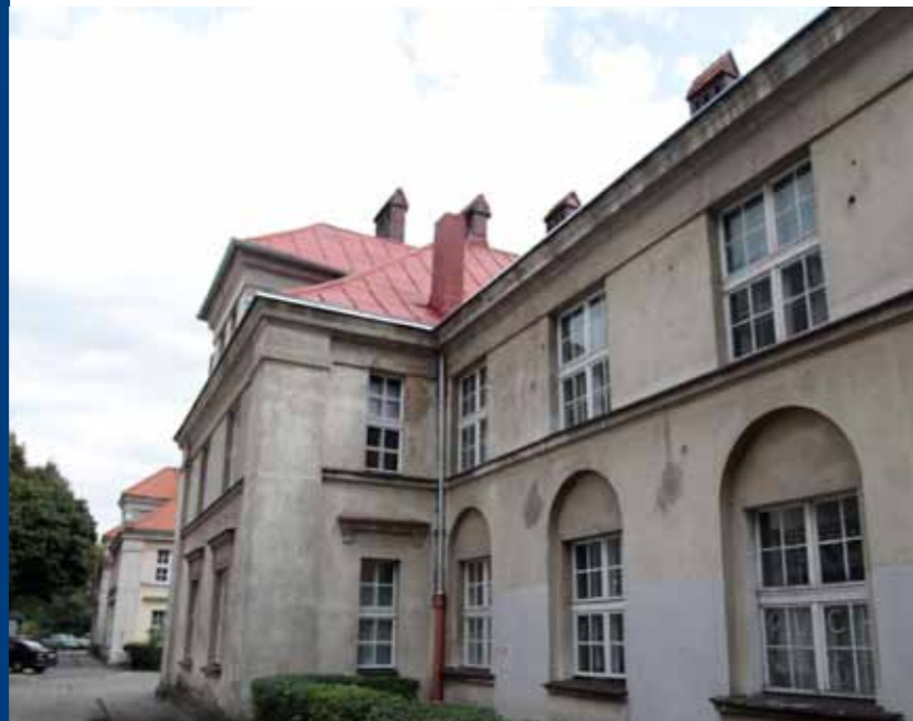
G Osiedle Lokator