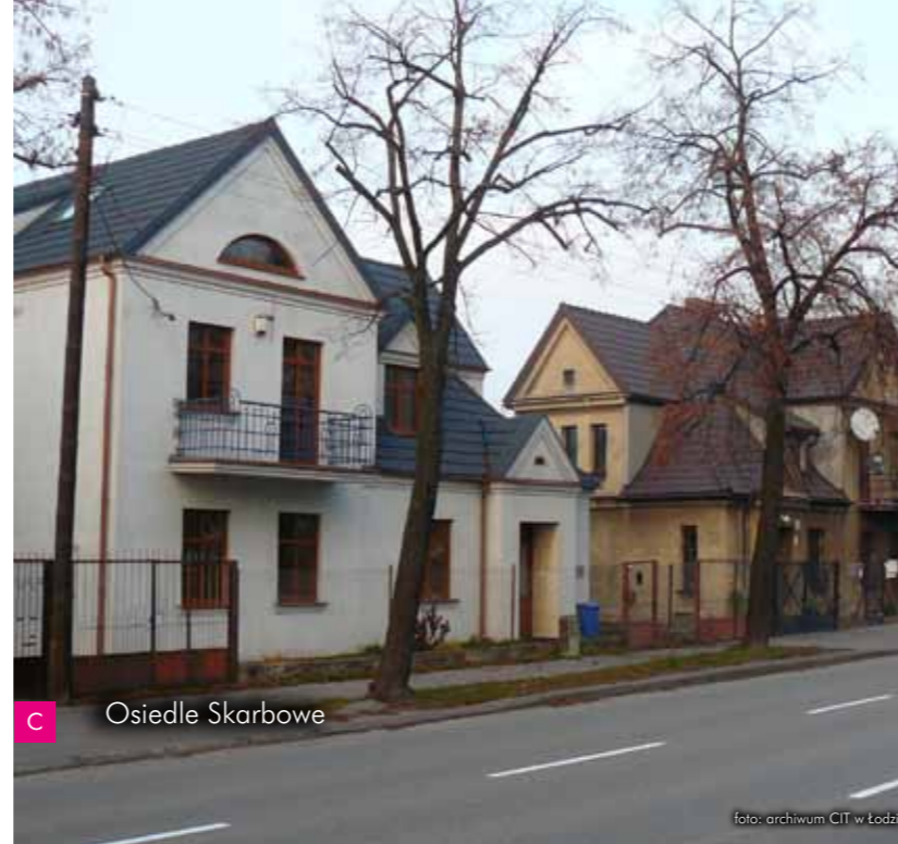
C Osiedle Skarbowe

C Albero della Vita Villa - Noclegi ul. Kopcińskiego 34a, 90-154 Łódź tel. (+48) 663 840 666 www.villaalbero.pl Obiekt noclegowy urządzony w zabytkowej willi należącej do opisywanej kolonii oficerskiej.