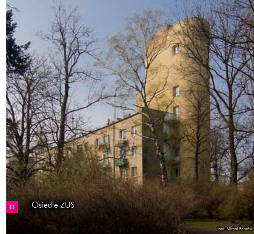
D Osiedle ZUS