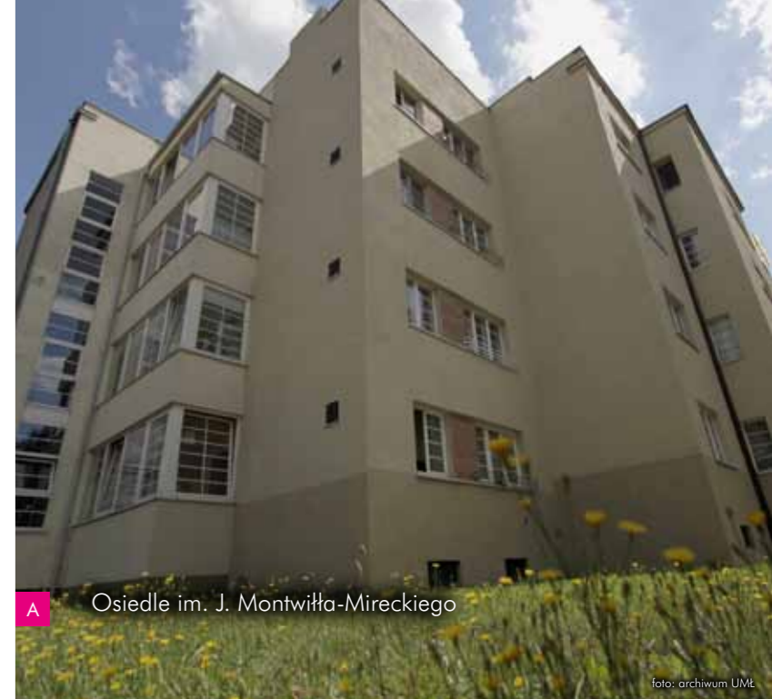
A Osiedle im. J. Montwiłła-Mireckiego

W latach 1930-1932 zaprojektowano w warszawskiej pracowni Biura Projektów ZUS osiedle dla łódzkich pracowników Zakładu Ubezpieczeń Społecznych. Początkowo osiedle miało składać się z 14 budynków, ostatecznie powstało ich 7. Wzdłuż ul. Bednarskiej stoją równoległe do siebie dwa dłuższe bloki, które wyróżniają się płaskimi dachami i pozbawionymi dekoracji elewacjami pokrytymi szarym tynkiem. Pomiędzy nimi zaprojektowano przestrzeń zieleni oraz mniejsze budowle, które utworzyły skrzydła poprzeczne osiedla. Co ciekawe, architekt uwzględnił w projekcie również domy dla robotników, m.in. galeriowce. Znakiem charakterystycznym osiedla jest wysoki budynek mieszczący niegdyś wieżę ciśnieniową, dzięki której