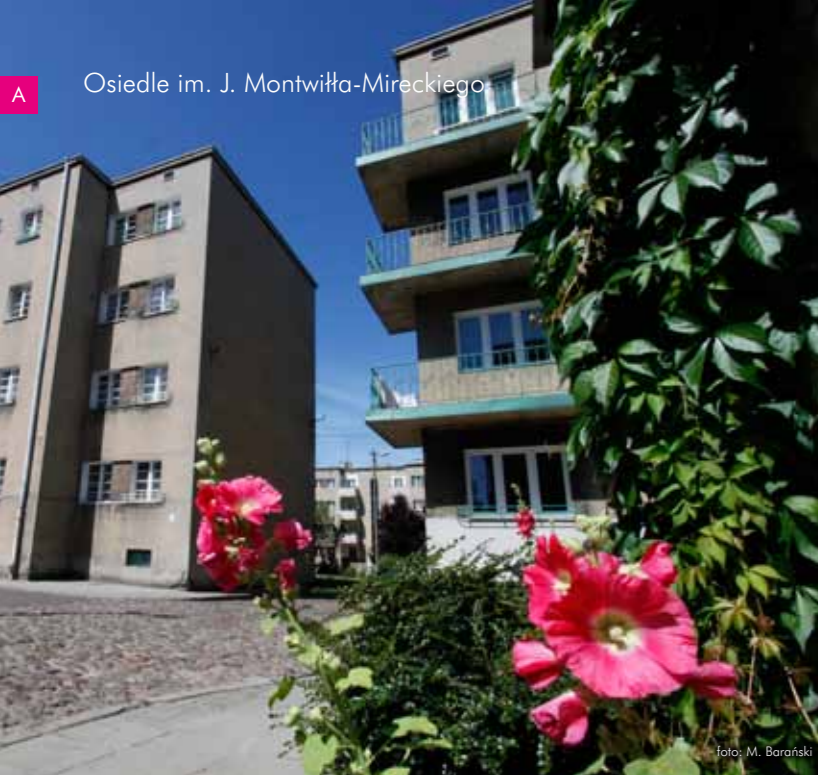
A Osiedle im. J. Montwiłła-Mireckiego