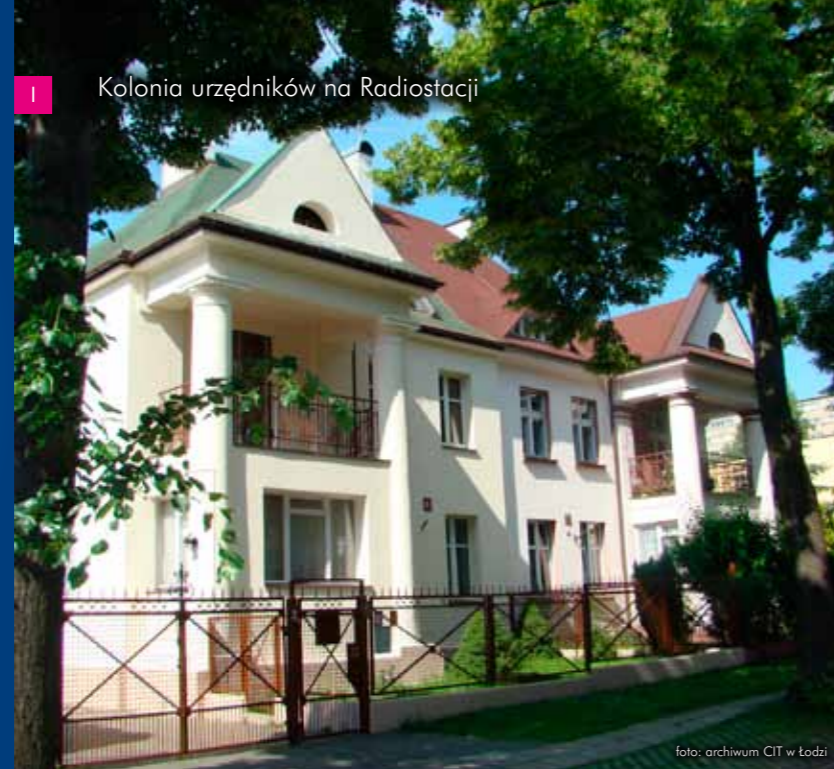
I Kolonia urzędników na Radiostacji

W latach dwudziestych i trzydziestych XX w. Łódź przeżywała okres odnowy i wielkich inwestycji. Miasto, do tej pory zaniedbane pod względem infrastruktury komunalnej, zaczęło nadrabiać zaległości. Rozbudowano wiedeńską gazownię, elektrownię, założono kanalizację, wybudowano zbiorniki wody na Stokach, nowoczesne szkoły, a także wzniesiono wiele budynków użyteczności publicznej. Świadectwem tego ciekawego okresu w historii Łodzi są także wybudowane wówczas osiedla mieszkaniowe. W latach międzywojennych łódzki przemysł włókienniczy przeżywał trudności w związku z ogólnoswiatowym kryzysem, natomiast Łódź awansowała pod względem rangi administracyjnej i nabrała wielkomiejskiego charakteru. Stała się stolicą województwa, nową diecezją łódzkiej oraz siedzibą garnizonu wojskowego. Potrzebne zatem były mieszkania dla nowych urzędników, wojskowych, dla ludności. Nowe osiedla powstawały najczęściej pod wpływem modernizmu. Jednym z głównych założeń tego kierunku w architekturze było odejście od historyzmu i podporządkowanie formy do funkcji. Osiedla łódzkie są wyjątkowe w skali kraju. Z tego też powodu ich architektura staje się coraz bardziej interesująca zarówno dla mieszkańców Łodzi jak i turystów. Zapraszamy do cofnięcia się w czasie i do powędrowania śladami międzywojennej Łodzi.