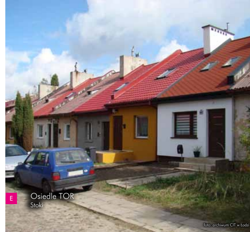
E Osiedle TOR Stoki