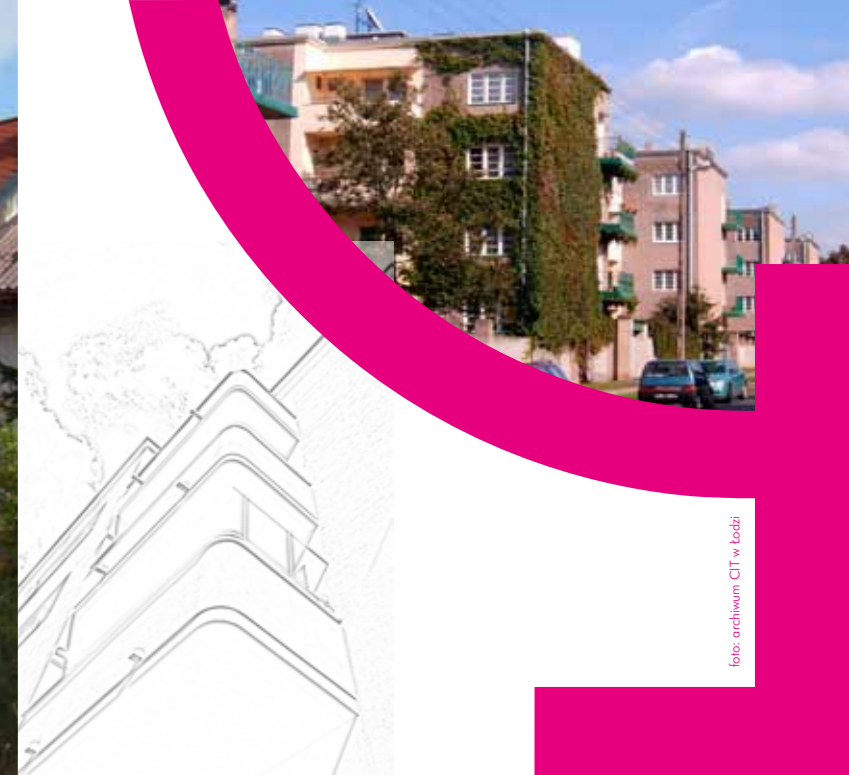
A Osiedle im. J. Montwiłła-Mireckiego