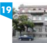
WILLA LEONA RAPPAPORTA, ul. Rewolucji 1905 r. 44

Przeznaczenie budynku było nie tylko rezydencjonalne, jak mogłaby sugerować nazwa, lecz także administracyjno-biurowe - na parterze znajdował się firmowy kantor Leona Rappaporta. Budynek wzniesiono w latach 1904-1905. Właściwej bryle towarzyszą wieżyczki, okna i balkony o najróżniejszych rozmiarach i wykrojach. Umiejętne zastosowanie różnych materiałów, cegły i białego kamienia, podkreśla charakter budowli. Również tutaj pojawiają się liczne motywy liści dębu, kasztanowca, sosny.