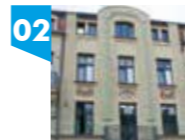
KAMIENICA, ul. Piotrkowska 41