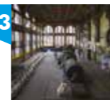
ELEKTROWNIA ZAKŁADÓW WŁÓKIENNICZYCH KAROLA SCHEIBLERA, ul. Tymienieckiego 3/7

Budynki maszynowni i kotłowni składające się na elektrownię dawnych zakładów Karola Scheiblera są jednym z nielicznych dzieł przemysłowej architektury secesyjnej w Polsce. Wybudowane zostały w 1910 r. zgodnie z projektem Alfreda Frischa. Charakterystyczna dla późnej secesji i modernizmu jest konstrukcja wykorzystująca elementy żelbetonu. Elewacje elektrowni o płynnych liniach i zakończonych miękkimi łukami dużych płaszczynach wielodzielnych okien, wskazują również na secesyjną proveniencję budynku. Dodatkowo całość wykończono kontrastującymi materiałami - jasnym tynkiem i czerwoną klinkierową cegłą. Imponująco prezentuje się wnętrze maszynowni, gdzie poza zachowanymi pierwotnymi elementami parku maszynowego w hali turbin zachowały się dekoracje ceramiczne o secesyjnych ornamentach i witraże. Ceramicznymi płytkami wyłożono także klatkę schodową.