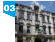
DAWNY DOM REDUTOWO – WESELY, ul. Wólczańska 5