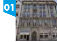
DOM BANKOWY WILHELMA LANDAUA, ul. Piotrkowska 29

Powstał wg projektu Gustawa Landau-Gutentegera na zlecenie warszawskiego bankiera Wilhelma Landaua, który potrzebował nowej siedziby w Łodzi. Parter nowego budynku zajmowały ekskluzywne sklepy, na pierwszym piętrze znajdował się bank, na dwóch górnych piętrach z kolei luksusowe mieszkania czynszowe. W kwestii stylu to monumentalny przykład połączenia formy neobarokowej z bogatym ornamentem secesyjnym. Architekt nie ograniczył się w modyfikacjach wszelkiego detalu architektonicznego oraz wypełnianiu różnego rodzaju płycin: elewacja pełna jest ornamentów roślinnych, masek i maskaronów. Głównego wejścia od strony ulicy Piotrkowskiej strzeże Merkury – opiekun handlowców. Zdobień nie brakuje nawet na kopule, którą zdają się obrastać kolejne drzewa.