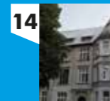
Kamienica, ul. Kilińskiego 136