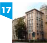
SZKOŁA ZGROMADZENIA KUPCÓW, ul. Narutowicza 68

Budynek powstał latach 1909-1911 według zwycięskiego w konkursie projektu Gustawa Landau-Gutentegera. Elewacje budynku zdradzają inspiracje wiedeńską moderną poprzez nałożenie geometrycznego ornamentu w formie kwadratowych płycin. To monumentalne założenie stanowił synonim nowoczesności i rozmachu. Jednostajność architektury przełamuje ryzalit zwieńczony kopułą, akcentujący wschodnią elewację. Obecnie jest to jeden z gmachów Uniwersytetu Łódzkiego.