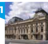
PAŁAC IZRAELA POZNAŃSKIEGO, ul. Ogrodowa 15

Posesję przy ulicy Ogrodowej zakupił w roku 1877 Izrael Poznański. Budowa nowej, reprezentacyjnej siedziby rodu nastąpiła dopiero pod koniec lat 80. Pierwotny projekt Hilarego Majewskiego został w czasie późniejszym przekształcony przez Adolfa Zelingsona i Franciszka Chelmińskiego. Choć nie ma wątpliwości co do eklektycznej formy budynku, można się również doszukać śladów stylu secesji. Na uwagę przede wszystkim zasługują klatka schodowa czy też sypialnia Poznańskiego z garderobą, które do dnia dzisiejszego pozostały w formie niemal niezmienionej. Ściany pokryte mahoniową boazerią z secesyjną dekoracją łączą się stylowo ze skromnymi meblami o obłych kształtach ze złotymi taśmami zdobitymi płyciną. W duchu secesji został również wykonany paw nad kominkiem w sali jadalnej, przede wszystkim jego ozdobny ogon w formie witrażu.