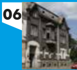
PAŁAC REINHARDA BENNICHA, ul. Gdańska 89