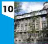
DAWNE NIEMIECKIE GIMNAZJUM REFORMOWANE, al. Kościuszki 65

W wyniku wydania w roku 1905 manifestu carskiego, pozwalającego na tworzenie szkół narodowych, niemiecka społeczność powzięła decyzję o stworzeniu własnej szkoły. W konsekwencji w roku 1910 wzniesiono gmach gimnazjum projektu Karla Hemringa. Choć ostateczny kształt szkoły odpowiada typowi niemieckiej architektury modernistycznej tamtego czasu, nadal można doszukać się detali i form wywodzących się z tradycji secesyjnej w postaci wielobocznych form okien w partii poddasza, czy zamkniętych miękkimi łukami na drugim piętrze. O charakterze instytucji przypomina kartusz wieńczący wejście z wyobrażeniem sowy oraz ula pszczół.